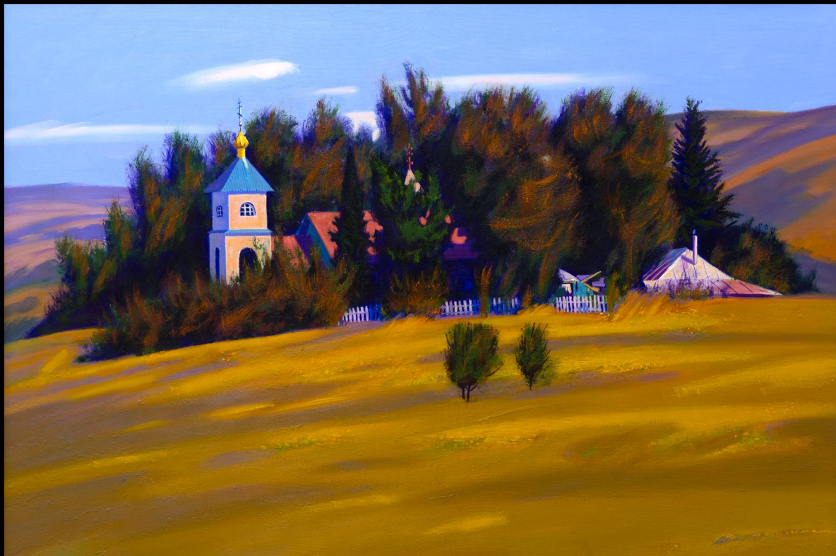
Виктор Рогачёв | Никольская церковь | 2021