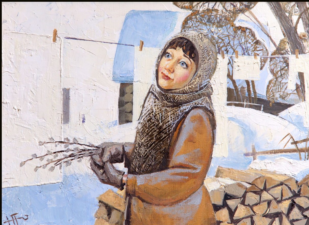
Юрий Попов | Вербна | 40×30 | 2002