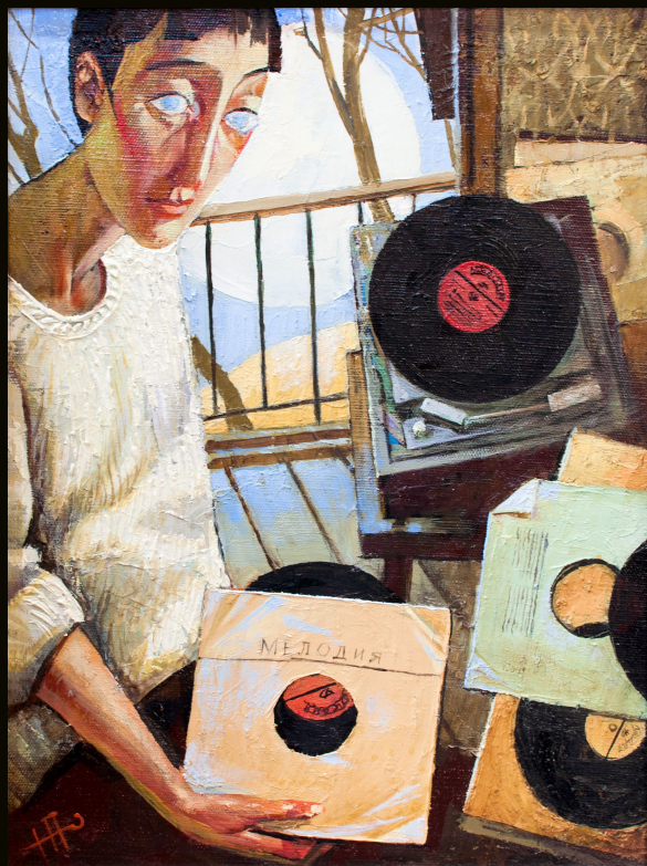
Юрий Попов | Старые грампластинки | 40×30 | 2014