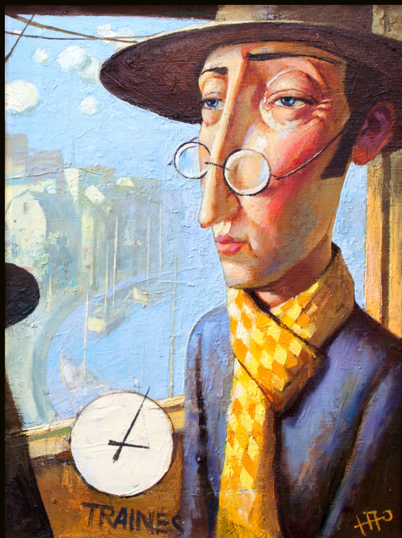
Юрий Попов | Электрички | 40×30 | 2014