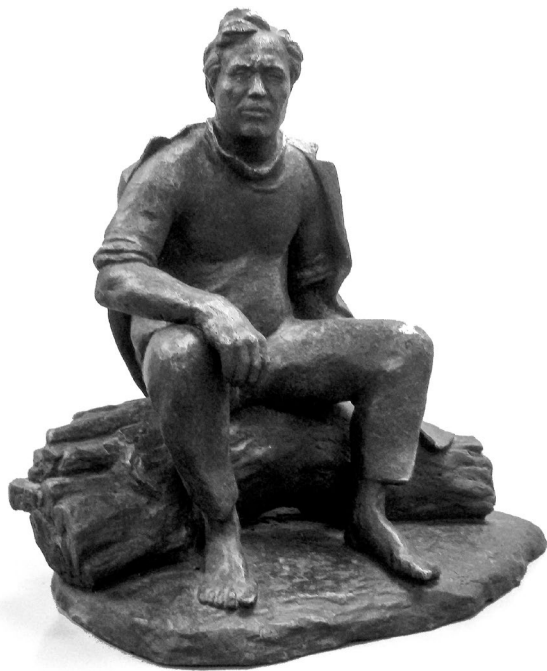
Писатель В. П. Астафьев