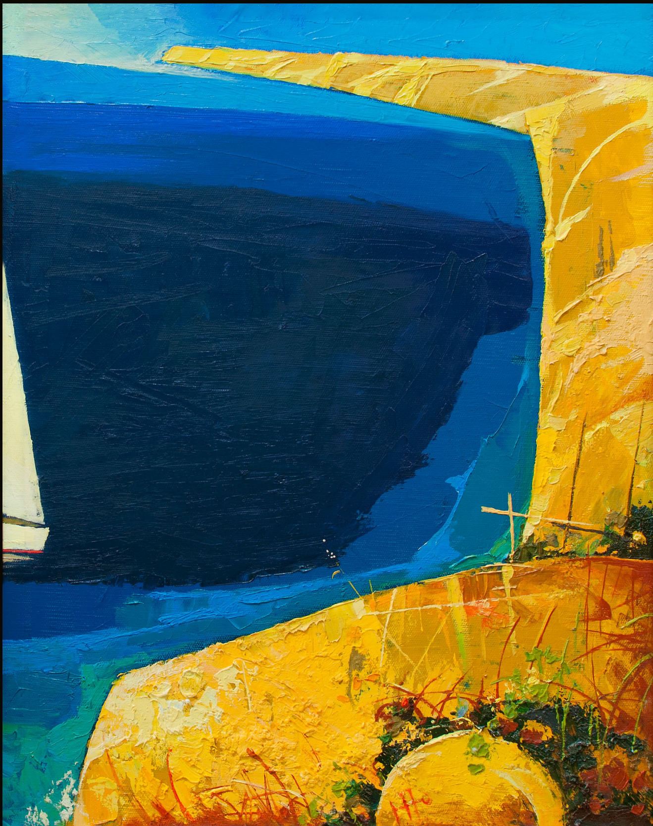
Юрий Попов Южный берег | 50 × 40 | 2014