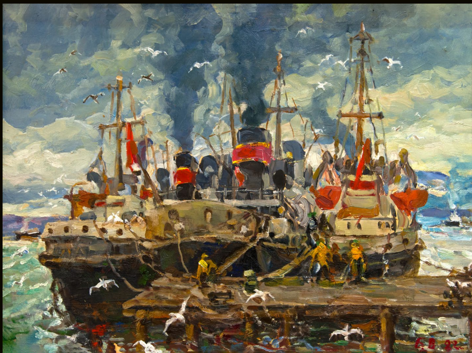
Вольдемар Бурмакин | Камчатка на приколе