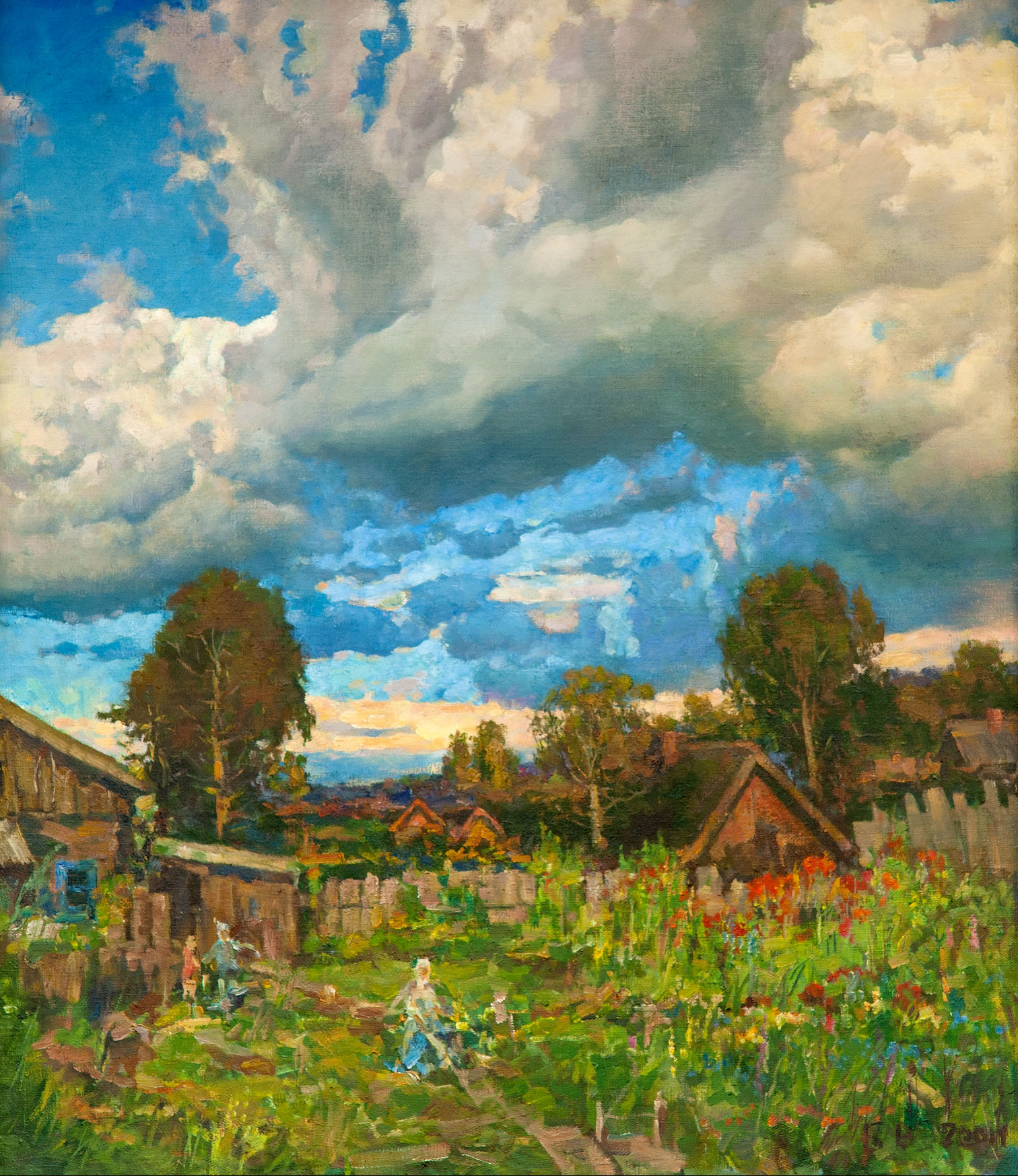
Вольдемар Бурмакин Вечер. Мой дом