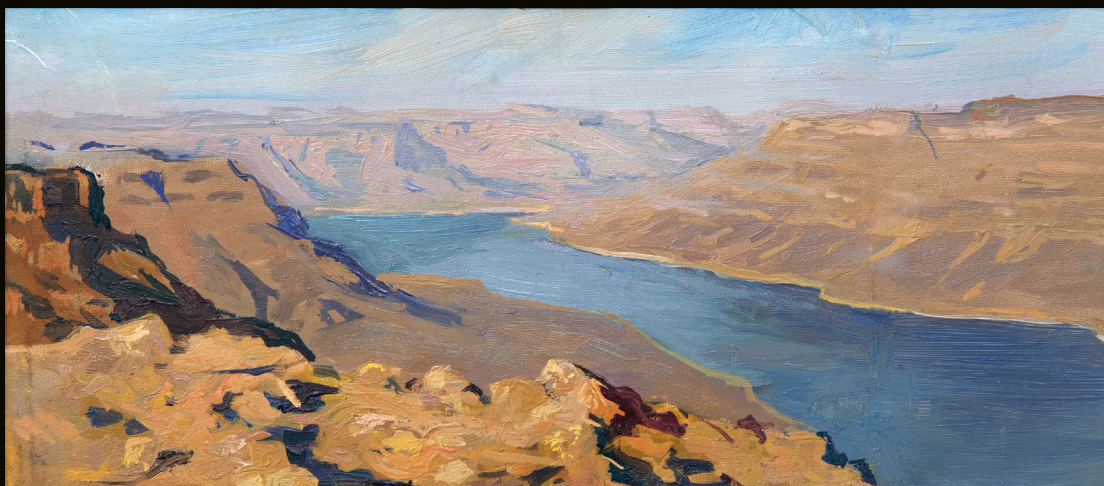
Природа затихла | 2016