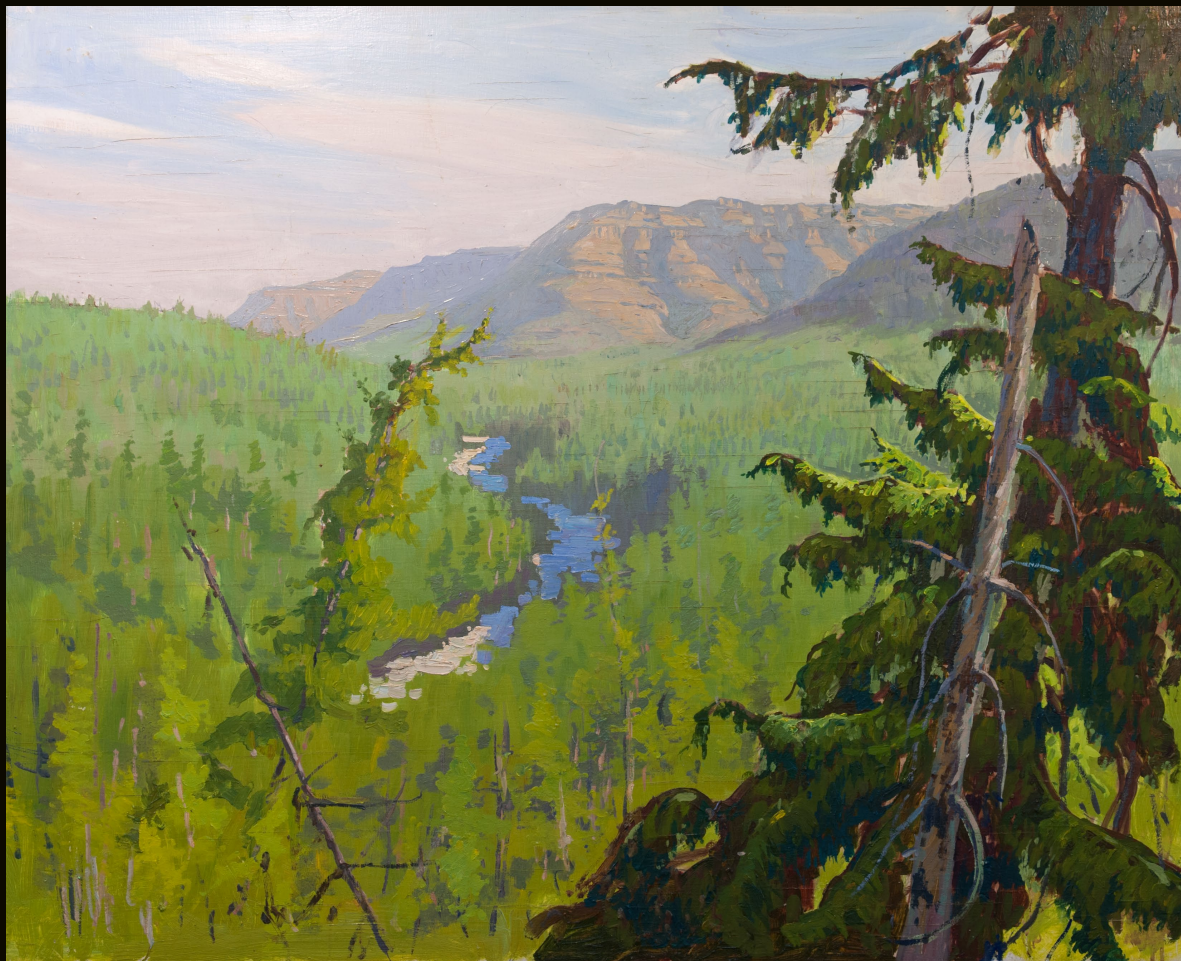
Долина реки Хойси | 2016