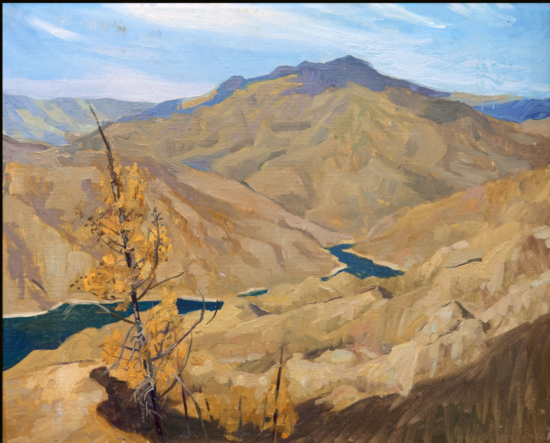
Шугур. Саяно-Шушенский заповедник | 2015